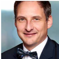
André Katz contec GmbH