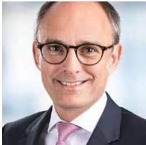
Dr. Christian Heitmann Curacon GmbH